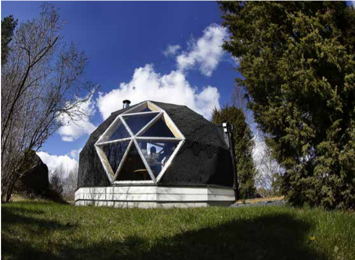
Bastun som står på tomten sticker ut med sin speciella form.

” Visst blev jag deppad när det blev fel, men tänk vad fattig man är om man vill snickra ihop något men inte vågar. Den som inte vågar blir bitter.